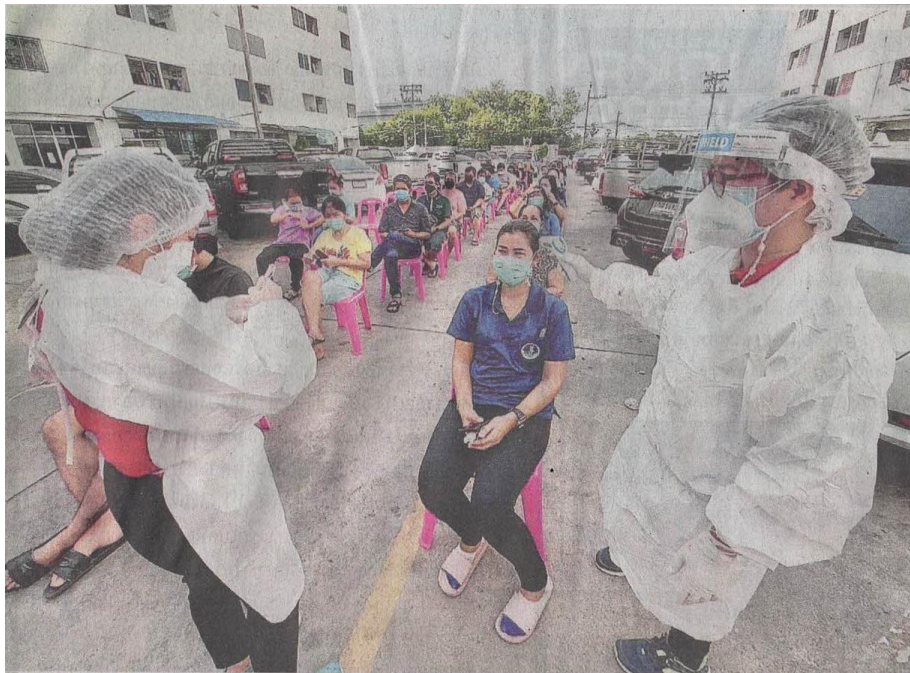
▲ ตรวจเชิงรุก เจ้าหน้าที่สำนักงานสาธารณสุขจังหวัดนนทบุรีตรวจเชิงรุกประชาชนในชุมชนตอนแจ้งศิษย์แมนชนัน ชุมชนซอยโรงน้ำแข็ง ซอยนนทบุรี 20 ต.บางกระสอ อ.เมืองนนทบุรี หลังมีผู้ติดเชื้อโควิด-19 ที่ จ.นนทบุรี จำนวนมากและปิดตลาดสีทองหลังพบลูกจ้างชาวเมียนมาในตลาดติดเชื้อโควิด.

ข่าวประจำวันพฤหัสบดีที่ ๒๐ พฤษภาคม ๒๕๖๔ หน้าที่ ๑