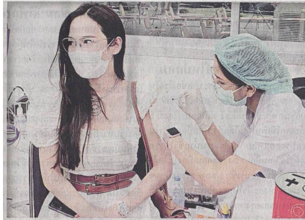
▲ ฉีดวัคซีน...อิม-พัชราภา ไชยเชื้อ นางเอกซูเปอร์สตาร์ โพสต์ภาพผ่านอินสตาแกรม พครอบครัวเข้ารับการฉีดวัคซีน ผ่านการลงทะเบียนของระบบราชวิทยาลัยจุฬาภรณ์

ข่าวประจำวันพฤหัสบดีที่ ๒๐ พฤษภาคม ๒๕๖๔ หน้าที่ ๑