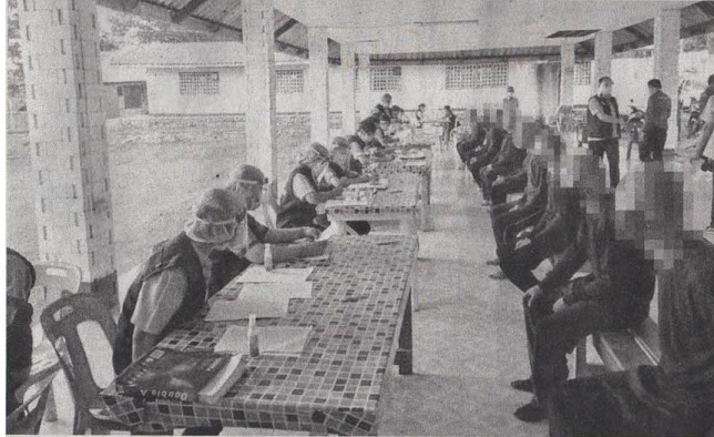
เช็กโควิด - เจ้าหน้าที่สาธารณสุข ตรวจคัดกรองโควิด-19 ในเรือนจำจังหวัดตราดและเรือนจำชั่วคราวเขาชะเมา รวมทั้งสิ้น 1,074 คน โดย 400 คนผลเป็นลบที่เหลือรอส่งผลตรวจสอบในพ่วงนี้ เมื่อวันที่ 19 พฤษภาคม

ข่าวประจำวันพฤหัสบดีที่ ๒๐ พฤษภาคม ๒๕๖๔ หน้าที่ ๕